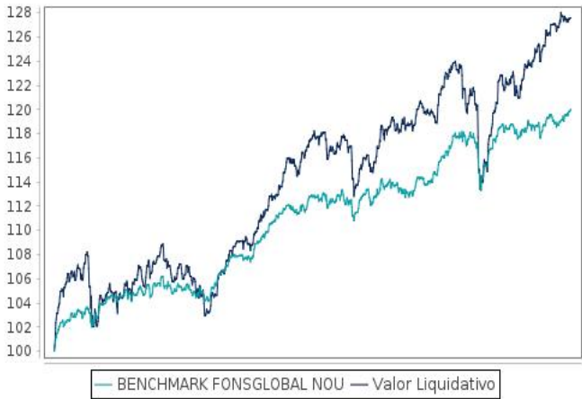
Evolución del valor liquidativo de los últimos 5 años